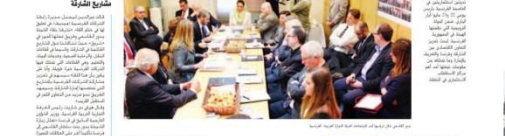
Sheikha Bodour Bint Sultan Al Qasimi, Chairperson of Shurooq, and other officials during the French SMEs conference in Paris.