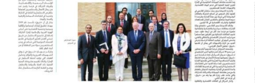
Participants and officials during the French SMEs conference in Paris.