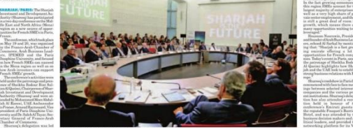
Officials and participants during the French SMEs conference in Paris.

Two-day conference in Paris focuses on how French SMEs can succeed in the Mena region