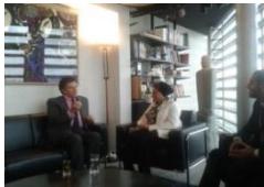
S.A. Sheikha Bodour et M. Jack Lang, Président de l’Institut du Monde Arabe