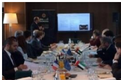
Rencontre avec le MEDEF International