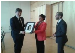
S.A. Sheikha Bodour et M. Arnaud Montebourg, Ministre de l’Economie