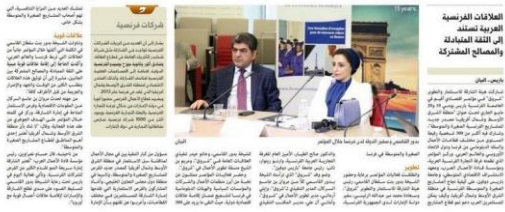
Sheikha Bodour Bint Sultan Al Qasimi, Chairperson of Shurooq, and other officials during the French SMEs conference in Paris.