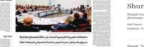
Participants and officials during the French SMEs conference in Paris.