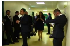
Rencontres face à face entre invités du Golfe et des patrons de PME et TPE de France et d’Europe